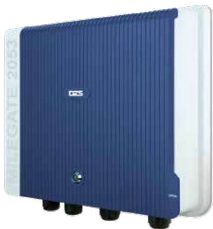
MileGate 205x G.fast-DPU (Distribution Point Unit)

Distribution Point Units (DPU) für ultra-breitbandige FTTB-Applikationen mit G.fast bis 212 MHz